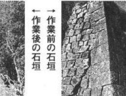
← 作業前の石垣 → 作業後の石垣

去る 1 月 16 日 (日) に青年部員 22 名と東牟婁振興局の職員有志 8 名と、元新宮城復元対策委員の小淵伸二さん立ち合いのもと、新宮城跡にて保全清掃活動を行いました。本丸にある天守台南面の横矢掛の 4 番目の石垣の姿を見えるようにするため、雑草やつるなどを取り除くとともに竹の伐採作業に汗を流しました。城の防衛システムの 1 つである横矢掛は、城壁を折り曲げることによって死角をなくし、正面と側面から攻撃を仕掛けるための工夫です。中でも、屏風折りは名前の通り屏風を折ったような形をしています。大阪城が有名ですが、間近で見ることができると新宮城は貴重なスポットです。また、石垣は野面積み、打込接、切込接の 3 種類に分けられ、新宮城はこの 3 つが見られる珍しい城です。今回、切り開く作業を行ったのは、城内で 1 番高い石垣で 4 連続の横矢掛にすることで防御力が入っていることが一目でわかります。