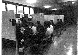
新宮紀宝道路開通記念イベントの準備風景

本春秋、一般国道42号新宮紀宝道路が開通致します。開通にあたり、新宮紀宝道路開通記念イベント実行委員会主催による「新宮紀宝道路開通記念イベント」を開催されますので、是非お越しください。 ◆日時 令和6年9月29日(日) 10時~16時(予定) (予備日:10月6日(日)) ◆場所 一般国道42号新宮紀宝道路河口大橋、新宮木材協同組合周辺 ◆内容 ・二重交流網引き大会 ・「木材並べ」でギネスに挑戦 ・ステージイベント ・広域交流物産展 ※二重交流網引き大会「木材並べ」でギネスに挑戦については事前にお申し込み頂く必要があります。詳しくは4面をご覧ください。 ◆その他別日には、ウォーキングイベント&提灯行列や自衛隊音楽隊による記念コンサートも予定されています。